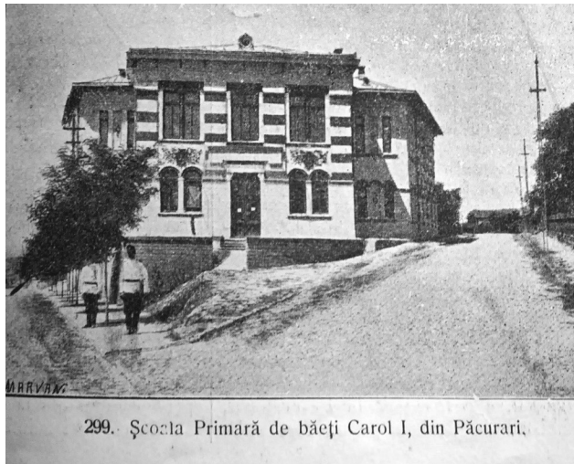
299. Școala Primară de băieți Carol I, din Păcurari.

O altă inițiativă legislativă aparținând aceluiași ministru și enunțată în 1891 a fost Legea pentru facerea clădirilor de școală primară și înființarea Casei Școalelor , prin care se încerca acoperirea lipsurilor localurilor școlare. Penuria de spații și imobile destinate unei desfășurări adecvate instrucției în învățământ a fost principala cauză pentru care nu s-a apli-