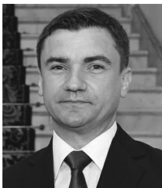
Mihai Chirica, Primar al Municipiului Iași